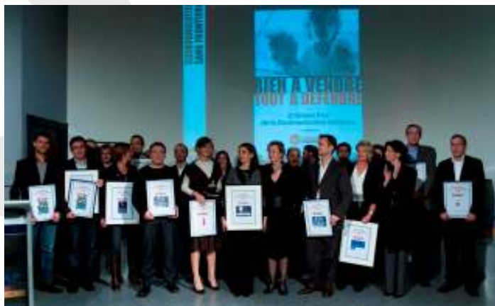
Les lauréats du Grand Prix de la Communication Solidaire 2006

Depuis 4 ans, à l'initiative de Communication Sans Frontières® , se déroule à Paris le Grand Prix de la Communication Solidaire dans le but de récompenser les professionnels de la communication et acteurs du secteur solidaire pour la qualité et l'éthique de leur campagnes publicitaires.